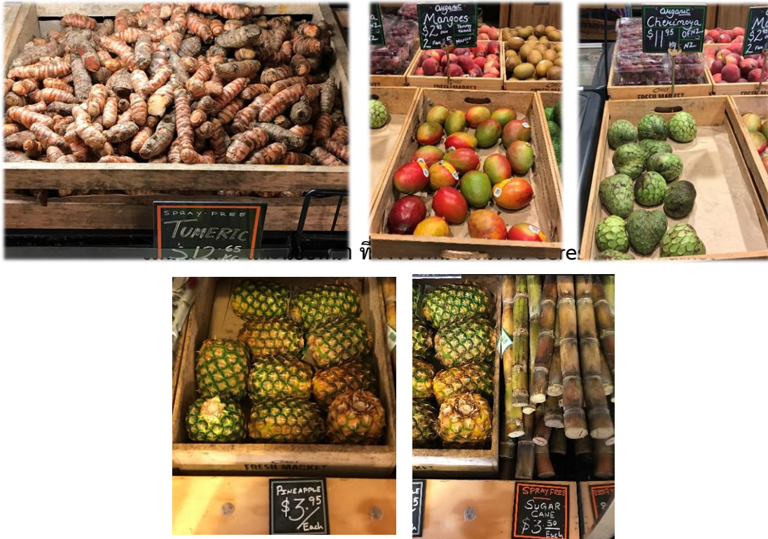
สับปะรด และอ้อย ที่วางจำหน่ายในร้าน Ceres Fresh Market

๓) พบการจำหน่ายพืชสมุนไพรและผลไม้บางชนิดที่ประเทศไทยสามารถปลูกได้ เช่น ขิง ขมิ้น มะม่วง (นำเข้าจากประเทศเม็กซิโก) น้อยหน่า (ผลิตภัณฑ์ท้องถิ่น) สับปะรด และอ้อย