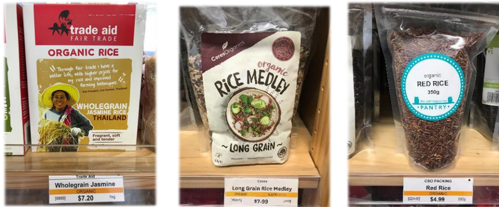
ตัวอย่างผลิตภัณฑ์ข้าวออร์แกนิกจากประเทศไทยที่จำหน่ายในร้าน commonsense Organics

มะเขือเทศ แครอท เป็นต้น สำหรับผลิตภัณฑ์อาหารแปรรูปมีความหลากหลายของผลิตภัณฑ์ให้ผู้บริโภคได้เลือกซื้อ มีทั้งผลิตภัณฑ์ในประเทศและผลิตภัณฑ์นำเข้าจากหลายประเทศ รวมทั้งจากประเทศไทย โดยเฉพาะอย่างยิ่งผลิตภัณฑ์ข้าวออร์แกนิกและผลิตภัณฑ์แป้งมันสำปะหลัง