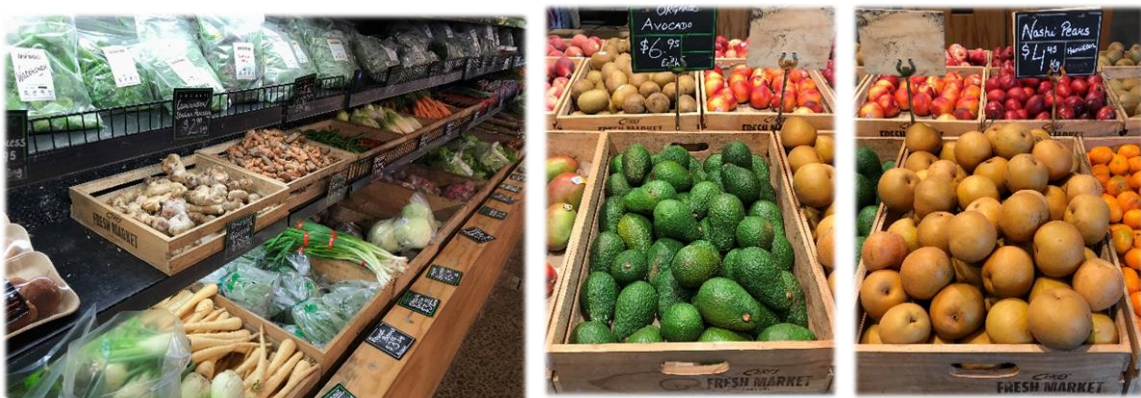
ตัวอย่างผลิตภัณฑ์ผักและผลไม้ที่วางจำหน่ายในร้าน Ceres Fresh Market