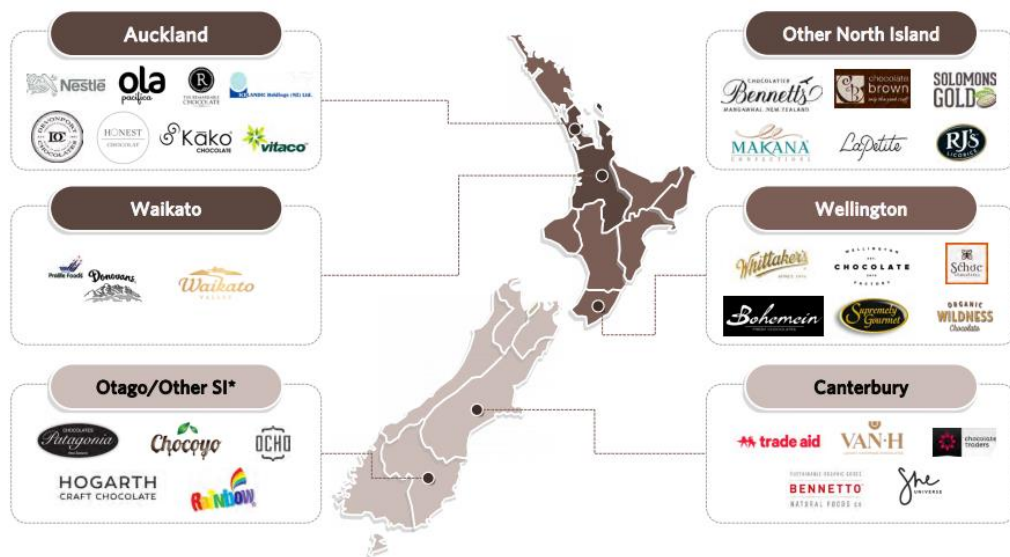
ภาพที่ ๒.๒ บริเวณที่ตั้งของโรงงานผลิตช็อกโกแลตและผลิตภัณฑ์จากโกโก้ในนิวซีแลนด์

ส่วนการผลิตช็อกโกแลตในนิวซีแลนด์นั้นเริ่มมีมาตั้งแต่ช่วงคริสต์ศักราช ๑๘๖๐ โดยมุ่งเน้นการผลิตเพื่อลดการนำเข้าผลิตภัณฑ์จากต่างประเทศ ปัจจุบันอุตสาหกรรมการผลิตช็อกโกแลตของนิวซีแลนด์เน้นการผลิตผลิตภัณฑ์พรีเมียมและผลิตภัณฑ์นวัตกรรม เน้นเอกลักษณ์และรสชาติเฉพาะตัว ปัจจุบันมีบริษัทผู้ผลิตมากกว่า ๑๐๐ บริษัทกระจายตัวทั่วประเทศ (ภาพที่ ๒.๒)