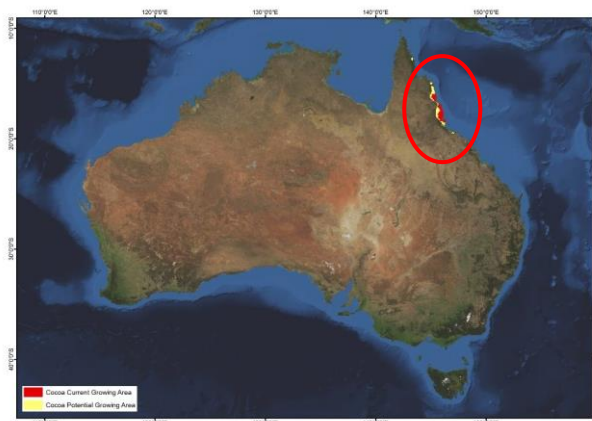
ภาพที่ ๑.๑ แหล่งเพาะปลูกโกโก้ของออสเตรเลีย

การปลูกต้นโกโก้ครั้งแรกของออสเตรเลียเกิดขึ้นในปี ๒๕๔๒ บริเวณตอนเหนือของรัฐควีนส์แลนด์ โดยเกษตรกรท้องถิ่น ซึ่งไม่ได้ปลูกเพื่อการค้า ต่อมารัฐบาลออสเตรเลียโดยการสนับสนุนของภาคเอกชน ได้จัดทำโครงการศึกษาความเป็นไปได้ในการปลูกต้นโกโก้เชิงพาณิชย์บนพื้นที่ ๓ รัฐ คือ รัฐนอร์ทเทิร์นเทรทอเรีย รัฐควีนส์แลนด์บริเวณตอนเหนือ และรัฐเวสเทิร์นออสเตรเลีย โดยใช้เมล็ดพันธุ์ลูกผสมนำเข้ามาจากปาปัวนิวกินี การทดลองใช้เวลายาวนานกว่า ๘ ปี จนกระทั่งในปี ๒๕๕๓ ผลการศึกษาสรุปได้ว่าพื้นที่ของออสเตรเลียที่มีศักยภาพในการปลูกต้นโกโก้ได้ดีที่สุดคือบริเวณ Mossman ทางตอนเหนือของเมืองแคนส์ รัฐควีนส์แลนด์ ปัจจุบันการเพาะปลูกส่วนใหญ่อยู่บริเวณแถบชายฝั่งตอนเหนือของรัฐควีนส์แลนด์ที่มีภูมิอากาศเขตร้อนรอบเมือง Mossman และ Innisfail (แสดงตามภาพที่ ๑.๑)